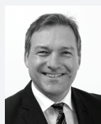
Frank Blass ICnova AG